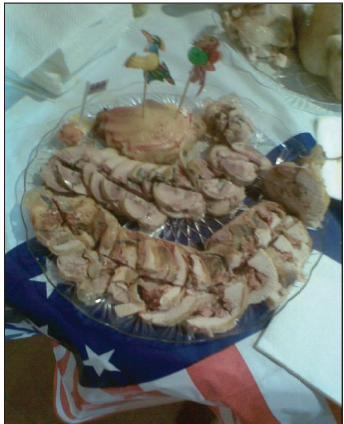
Chicken with mushrooms