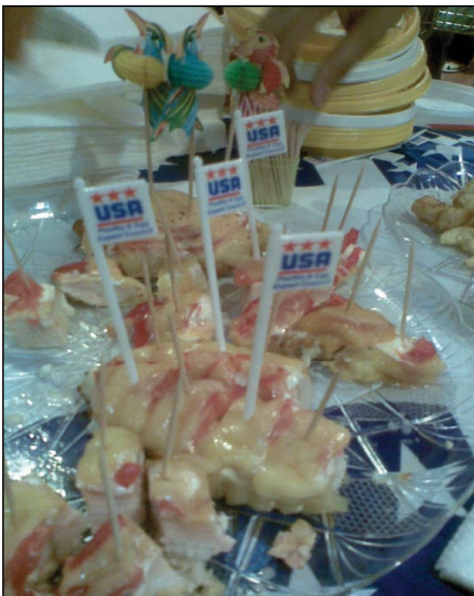
Boneless CLQs with cheese and tomatos